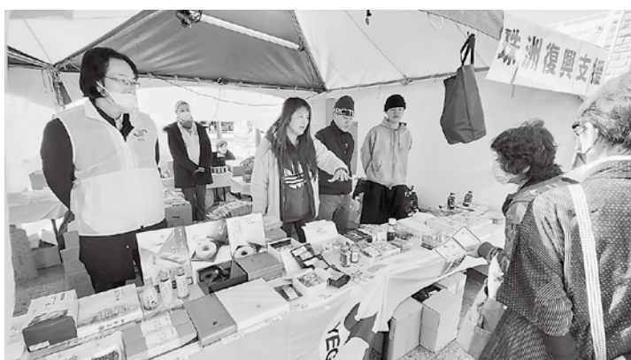
物産展で特産品を販売するメンバー