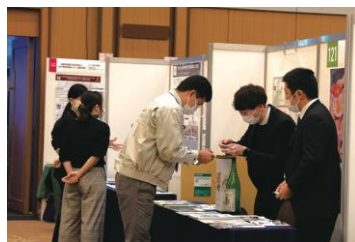
Matching HUB Hokuriku 2021 ブース展示の 様子