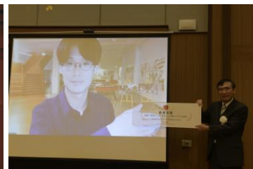
M-BIP (Matching HUB-Business Idea Plan Competition) 2021 表彰式の様子