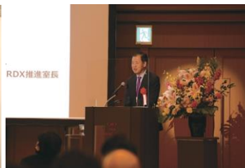
Matching HUB Hokuriku 2021 特別講演の 様子