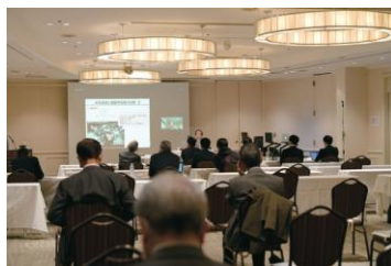
Matching Hokuriku 2021 パネルディスカッションの様子