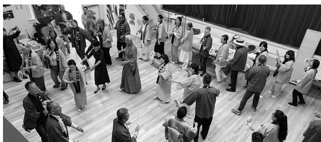
揃いの法被で踊る参加者