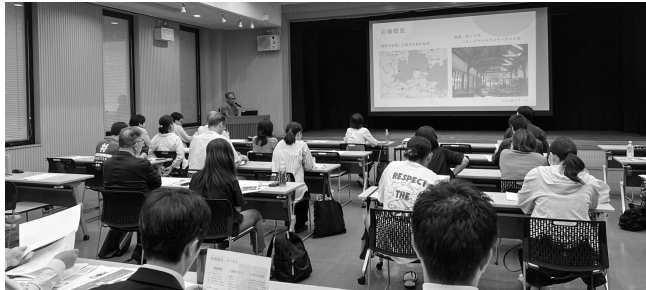
〈創業計画を発表した受講生の皆さん〉