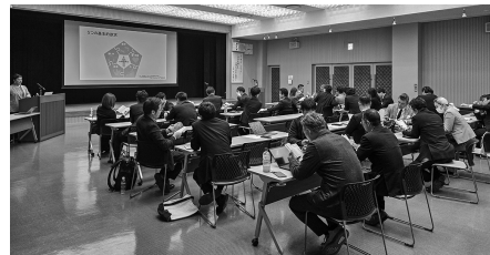
ワークショップ中の様子

参加者は、人間関係を壊す7つの致命的習慣(批判、責める等)を避け、「傾聴」「支援」など関係性を築く習慣と、5つの基本的欲求(愛所属、力、自由等)のバランスを知る重要性を学びました。監事からは、この気づきを実行に結びつけ、所属価値向上とビジネス活性化に繋げる期待が示され、学び多き定例会となりました。