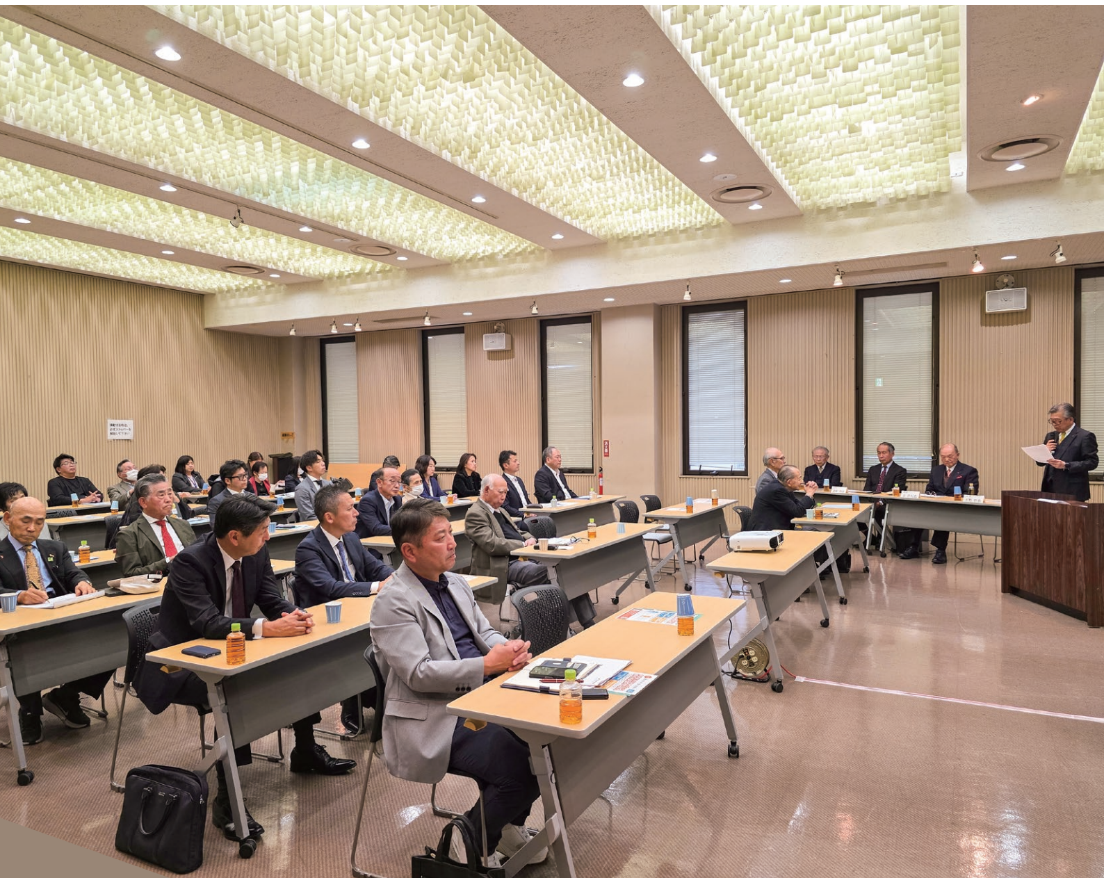
臨時議員総会を開催