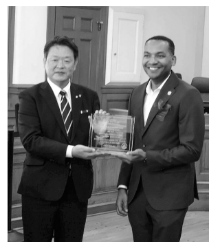
記念プレートを掲げる両市長