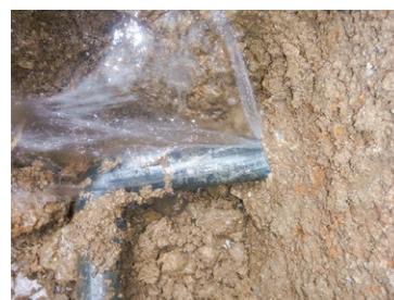
破裂している水道管の様子