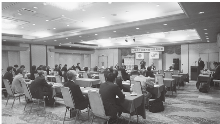
臨時議員総会の様子

10月28日(月)、役員議員等38名が出席のもと臨時議員総会を開催しました。1月1日に発生した能登半島地震の被害に伴う会館復旧工事に係る補正予算、並びに能登半島地震による被害の影響と厳しい社会情勢において、商工会議所として企業再生に向け、市内事業者を如何に支援していくか等復興指針を策定するための補正予算の専決の承認を頂きました。